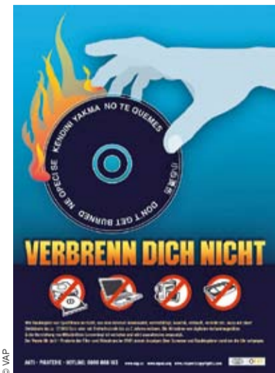
Piraterie trifft nicht nur große Filmstudios, sondern auch kleine Produzenten.